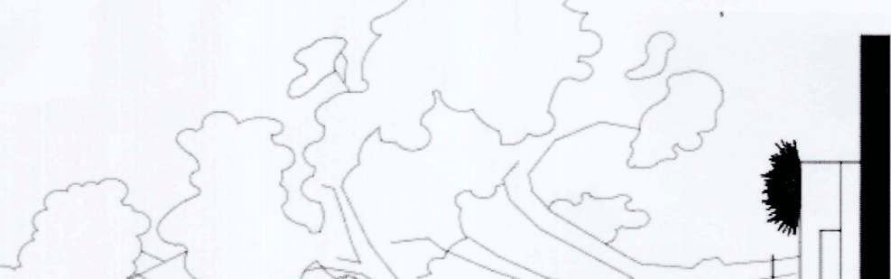
ΒΟΡΕΙΑ ΟΨΗ ΚΑ 1160