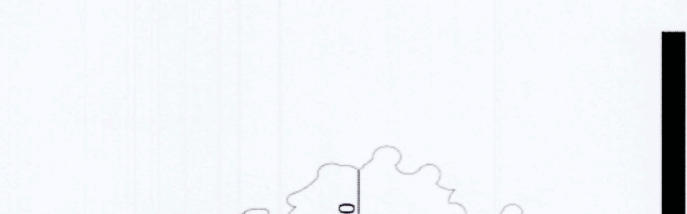
ΜΟΤΑ ΟΨΗ ΚΑ 1160