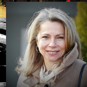
Αφήγηση Ντάνη Ανδρικάκη -Δώρα