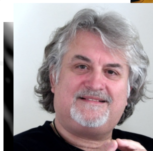
μαέστρος ΒΙΚΤΩΡ ΓΛΥΚΙΔΗΣ