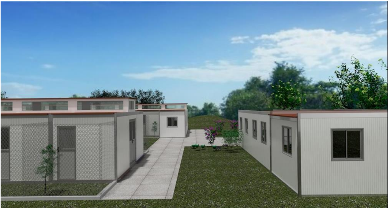
Εικόνα 4: Εξωτερική άποψη εγκαταστάσεων καταφυγίου αδέσποτων ζώων συντροφιάς.

Όσον αφορά την φάση της λειτουργίας το απαραίτητο προσωπικό της δομής προβλέπεται να είναι: