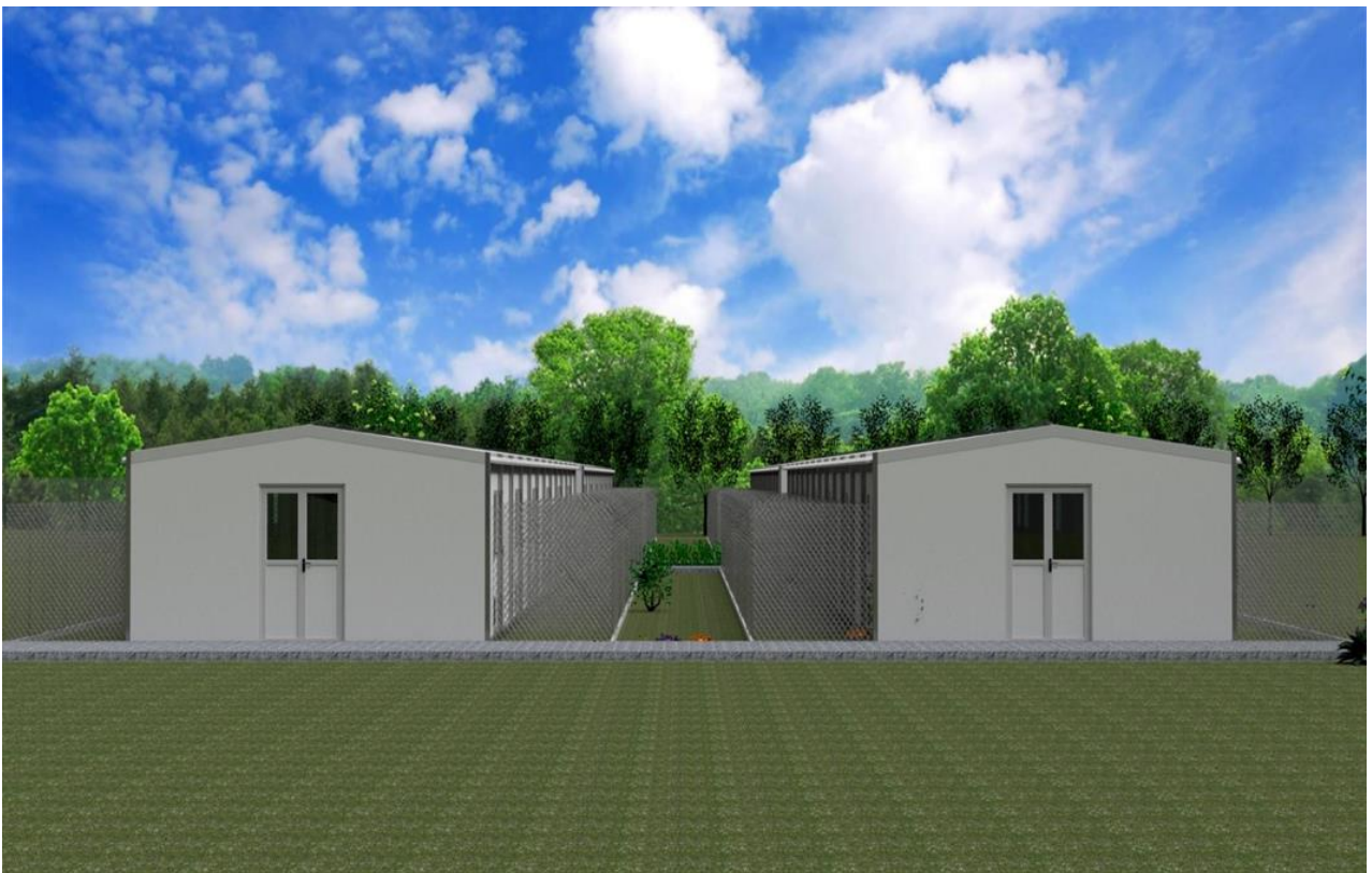
Εικόνα 3: Συνολικές εγκαταστάσεις φιλοξενίας ζώων.